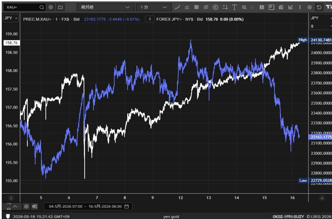
左軸：円建てゴールド/グラム 右軸：ドル円